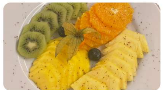
Fruit (1 pièce)

Au choix (ananas, mangue, melon, cerises et fraises - en saison).