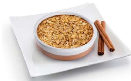
Tarte de Nata