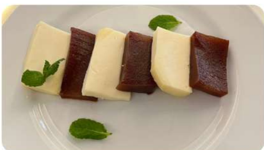
Roméo et Juliette