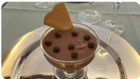
Mousse au chocolat (maison)