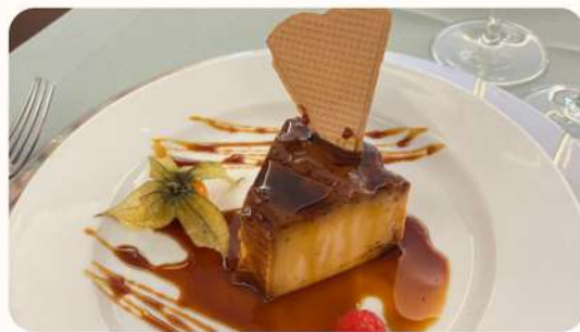
Pudim de Ovos (caseiro)