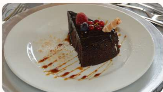
Tentação de Chocolate