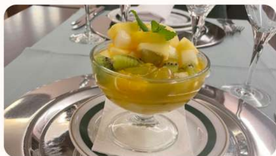
Salada de Fruta