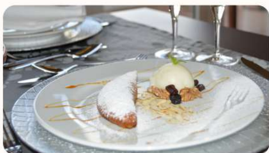
Doce Conventual de São Bento

Doce tradicional com recheio de chila. Acompanhado com bola de gelado.