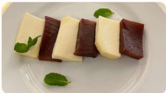
Romeu e Julieta (Queijo e Marmelada)