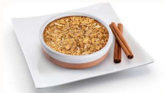
Tarte de Nata