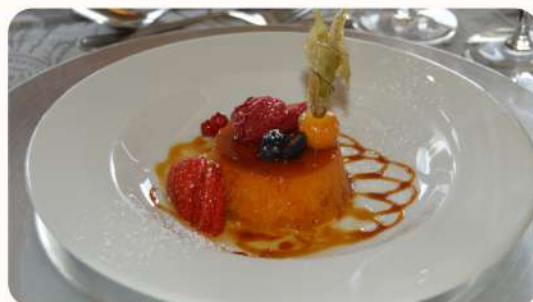
Pudim Abade de Priscos

Um doce típico da região de Braga. Feito com ovos, uma grande porção de açúcar, toucinho, vinho do Porto, raspa de limão e paus de canela.