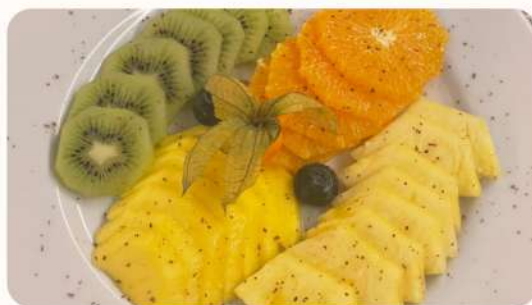
Fruta (1 peça)

Escolha entre (Abacaxi, Manga, Melão, Cerejas e Morangos- na época)