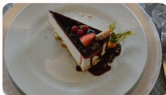
Cheesecake de Frutos Vermelhos