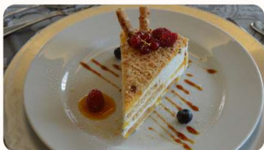
Bolo de Bolacha