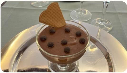
Mousse au chocolat (maison)