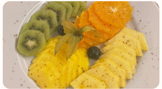
Fruit (1 pièce)

Au choix (ananas, mangue, melon, cerises et fraises - en saison).