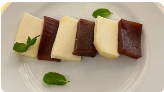
Roméo et Juliette (Fromage et marmelade)