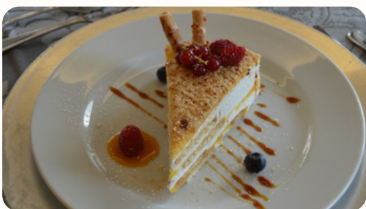
Bolo de Bolacha