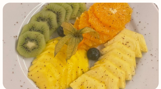
Fruta (1 peça)

Escolha entre (Abacaxi, Manga, Melão, Cerejas e Morangos- na época)