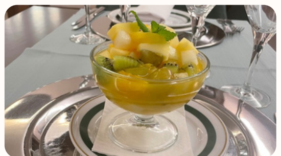
Salada de Fruta