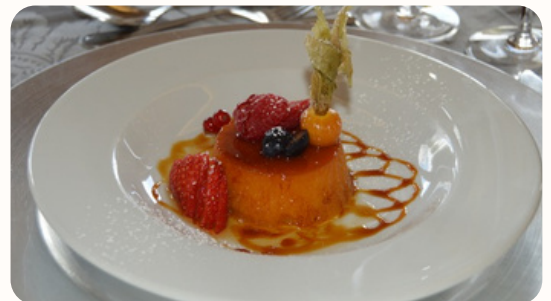
Pudim Abade de Priscos

Um doce típico da região de Braga. Feito com ovos, uma grande porção de açúcar, toucinho, vinho do Porto, raspa de limão e paus de canela.