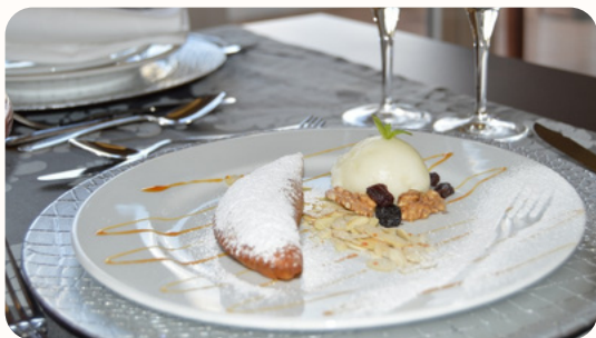
Doce Conventual de São Bento

Doce tradicional com recheio de chila. Acompanhado com bola de gelado.