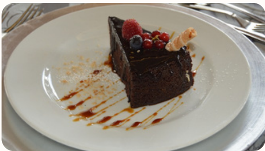
Tentação de Chocolate