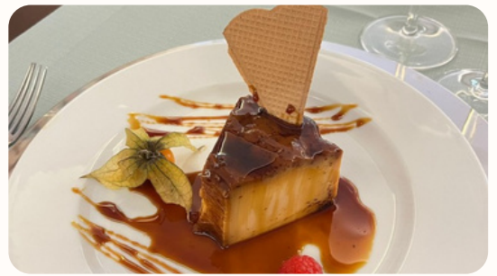
Pudim de Ovos (caseiro)